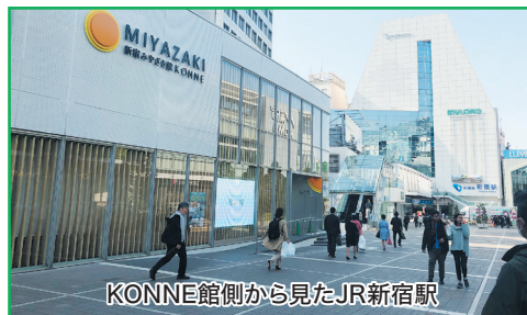
KONNE館側から見たJR新宿駅