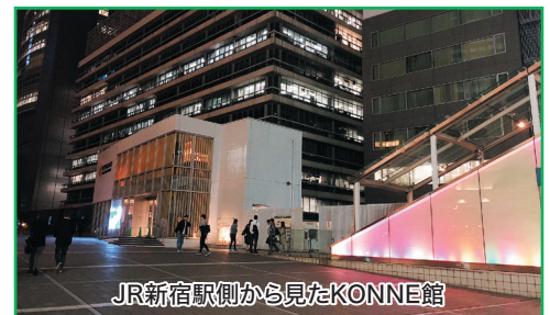
JR新宿駅側から見たKONNE館