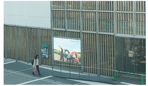
バスタ新宿からの見え方