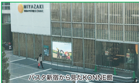
バスタ新宿から見たKONNE館